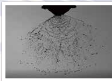
&lt;撮影事例&gt;19000 コマ / 秒